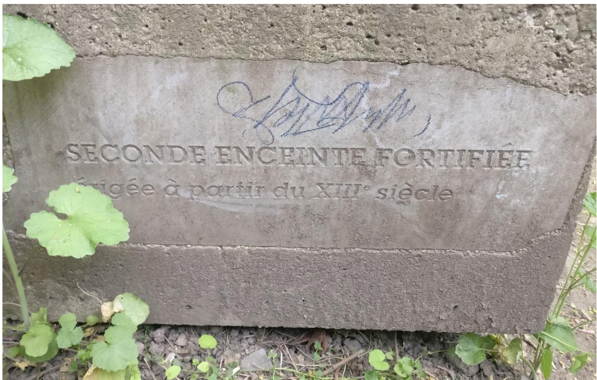
Borne indiquant l'emplacement de la seconde enceinte, dans un petit chemin entre la rue Pierreuse et la Citadelle (sentier de Favechamps).